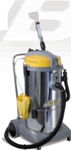
M 21 I Auto

La versión que Auto, ha suministrado la boquilla manual y un tubo de 6 m. (Ø 40) para facilitar la extracción del interior del coche en incluso el más difícil de alcanzar. Los modelos M 21 están equipados con una bomba con una potencia de 48 W, caudal 1,1 l / min, presión de 7 bar. Capacidad del depósito de detergente de 21 litros, llena fácilmente gracias a la gran boca de carga situada en el lado de la máquina. Tanque de recuperación (22 l) fácil de vaciar, es el tubo de escape utilizando que la eliminación de todo el tanque en unos pocos pasos simples. Control independiente de la contaminación accionada la bomba.