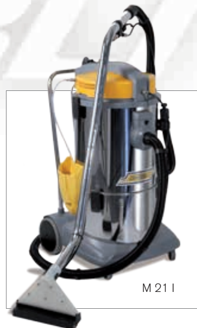
M 21 I