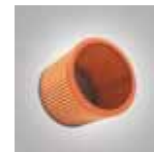
Filtro de cartucho