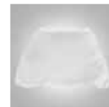
Filtro en nylon