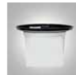
Filtro en tejido permanente