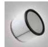
Filtro de cartucho lavable