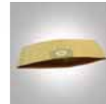
Filtro de bolsa en papel