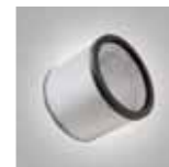
Filtro de cartucho HEPA